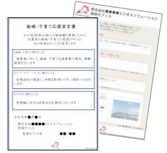
※1 宣言書・チラシのイメージ